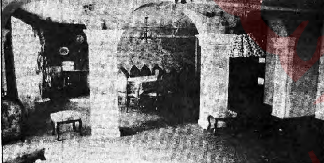
و این نمونهای از نمای داخلی مقر رهبران سازمان مجاهدین خلق است قسمی که از آنجا بنام خلق برضد او نقشه کشیده می‌شود