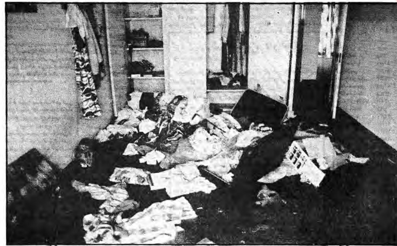
در این عکس گنجهها و جمعدانهای پراز لباس که بیشترشان خارجی و گران قیمت هستند دیده میشود