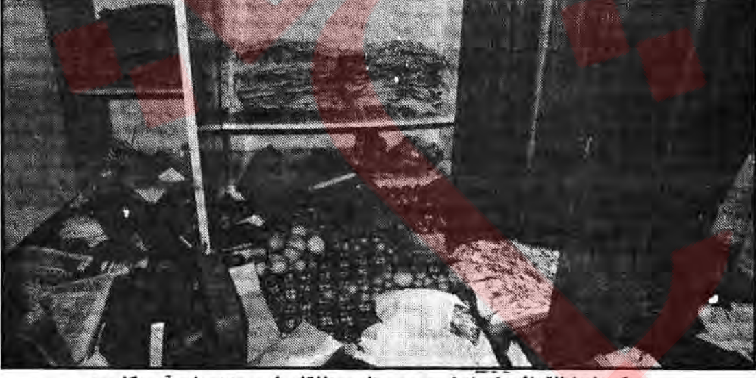
یکی از اتاقهایی که انبار میوه و نان منافقان این مزدوران آمریکا بود