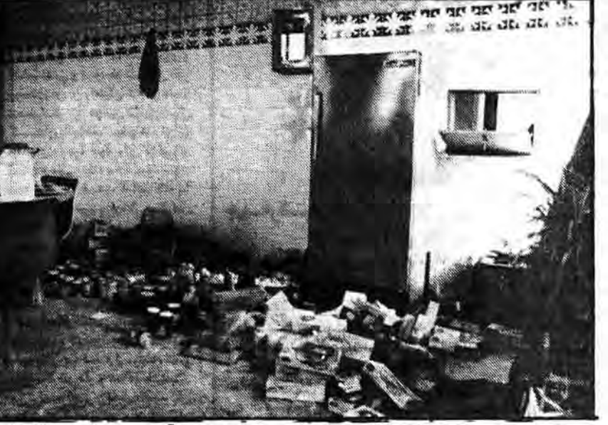
اشیزخانه و انبار آذوقه‌ای که اجناس موجود در آن میتوانست آذوقه منافقان و مزدوران آمریکائی را تا مدت زیادی تامین کند.

موسی خیابانی مزدور آمریکائی در حالیکه با اتومبیل ضد گلوله اهدائی بسنی صدر در حال فرار بود توسط پاسداران کشته شد.