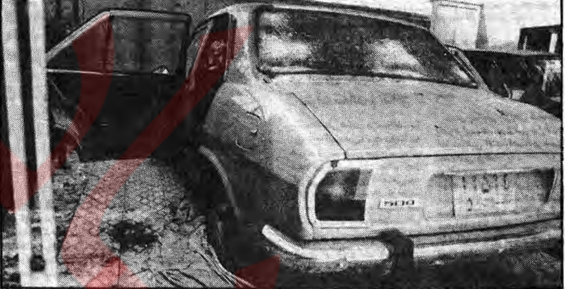
یکی از دو اتومبیل ضد گلوله موسی خیابانی که هدیه بنی صدر میباشد و توسط برادران پاسدار آسیب دیده و از کار افتاده است

موسی خیابانی مزدور آمریکائی در حالیکه با اتومبیل ضد گلوله اهدائی بسنی صدر در حال فرار بود توسط پاسداران کشته شد.